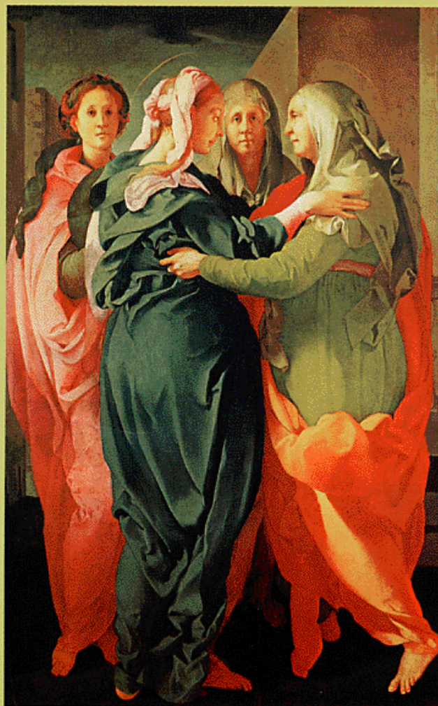
PONTORMO - Visitation, Pieve di S. Michele, Assieme (cm. 202x156)

Venerdì 4 Maggio 2007 - Ore 21,00 Chiesa dei SS. Giacomo e Filippo MERONE (CO)